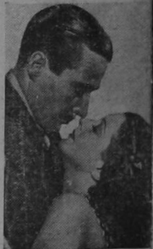
Después de intensas luchas emocionales, la felicidad sorprende a Douglass Montgomery Jacqueline Wells, en el emocionantísimo drama "La Noble Expiación".